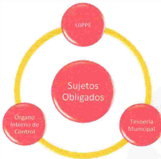
Participantes en el PAE 2026

El desarrollo del PAE 2026, consta de un primer documento que identifica el tipo de evaluación a desarrollar, posteriormente la elaboración de los Términos de referencia, el Convenio para la Mejora del Desempeño y Resultados Gubernamentales y los Resultados de la Evaluación, y así concluir con el monitoreo al cumplimiento de los Aspectos Susceptibles de Mejora.